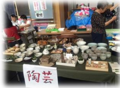
陶芸やパッチワーク作品の展示販売や、絵手紙作品の展示がありました。