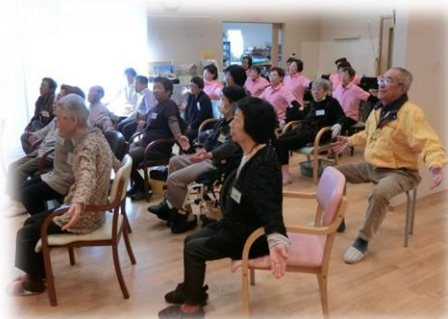
昼食前にかみかみ百歳体操