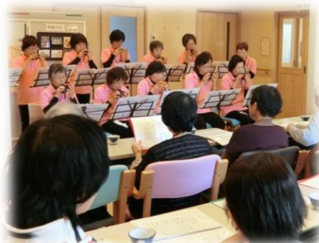
オカリナの伴奏で懐かしい歌を歌いました

13名の参加があり、参加者同士やヘルパーと 参加者が交流する良い機会になりました