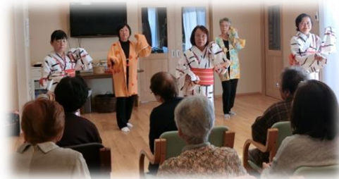
最後は炭坑節で飛び入り参加も！

13名の参加があり、参加者同士やヘルパーと 参加者が交流する良い機会になりました