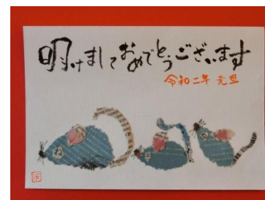
新聞ちぎり絵 米澤道代 作