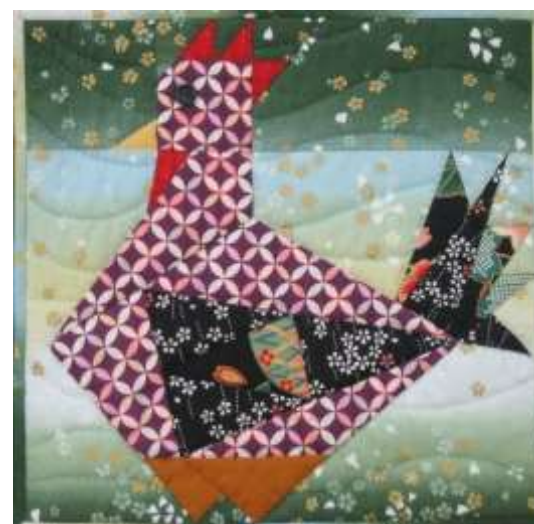
パッチワーク * 菊池秀子先生 作