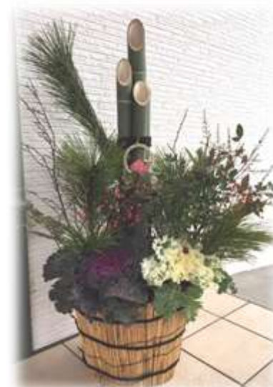
男性ヘルパー手作りの門松