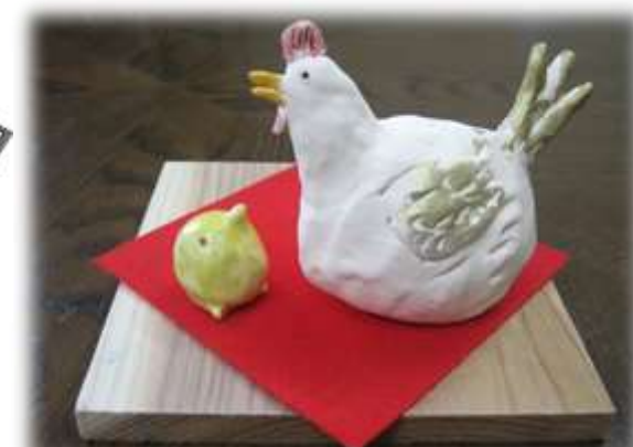
陶芸 * 佐藤 融 先生 作